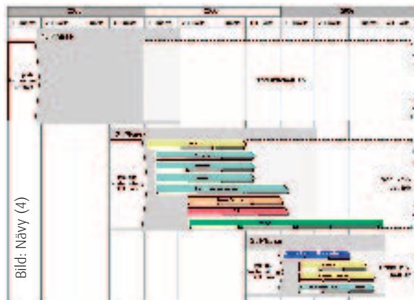
Implementierung in drei Phasen. Wer eine integrierte IT-Lösung für den Gebäudebetrieb realisieren will, darf den dafür notwendigen Zeitaufwand nicht unterschätzen.

Berechnung von unfertigen Leistungen sowie die Abgrenzung von nicht gebuchten Rechnungseingängen automatisiert.